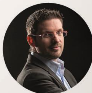
& Stéphane Pilleyre